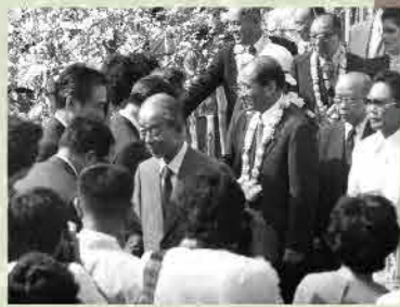
マニラを訪問する福田赳夫総理(当時)