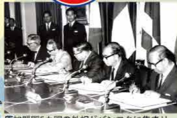
原加盟国5カ国の外相がバンコクに集まり、ASEAN設立宣言(バンク宣言)に署名