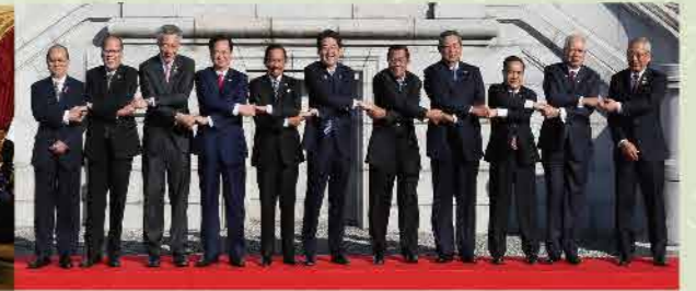
日・ASEAN特別首脳会議

2010's ASEAN共同体が設立。現在、ASEANは共同体を強固にするための様々な取り組みを推進しています。特にASEAN経済共同体は、域内で「ヒト・モノ・カネ」の行き来が自由になることで更なる経済の活性化が予測されており、ASEAN地域は経済成長が著しく、潜在力が高い地域として、日本のみならず世界中から注目を集めています。