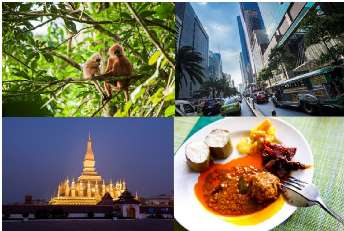
新規に追加された写真例 マレーシア・クリイロコノハザルの親子（左上）／ フィリピン・マカティ地区（右上） ／ラオス・タートルアン（左下）／ブルネイ・レンダンと竹筒もち米（右下）

フォトライブラリー手続き https://data.asean.or.jp/tourism/photo-li/user