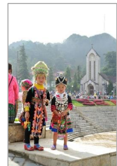
今回追加された写真の例 左から：タートルアン祭り(ラオス、ビエンチャン) / ワット・パクナム(タイ、バンコク) ポッパ山(ミャンマー、マンダレー) / 少数民族の少女(ベトナム、サパ)