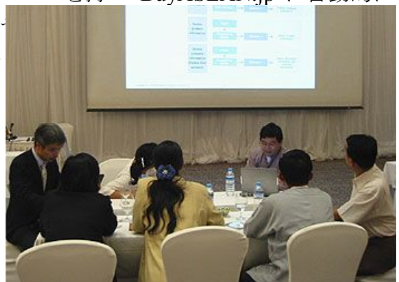
実際に操作をおこなう

セミナーに参加した商務省職員や民間企業関係者より、このようなシステムは、情報発信のツールを持たないミャンマーの製造業者・輸出業者にとって画期的で理想的なツールであり、積極的に活用していきたいという意見が寄せられました。