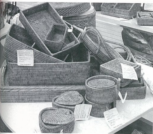
◀欧米、南米、アフリカ諸国に輸出しているエキゾチック・トレーディング社（ミャンマー）の各種藤製品