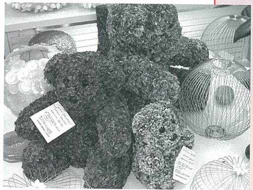
▲パペランペーパープロダクツ社（フィリピン）が紙で作った動物の飾り物